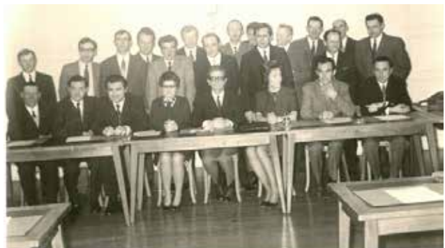
L'équipe de 1971