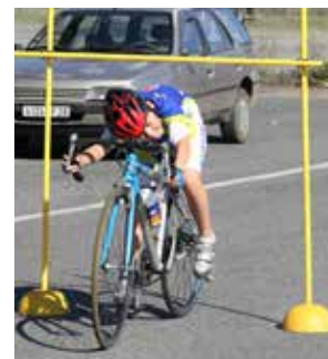
Association Cycliste Léonarde